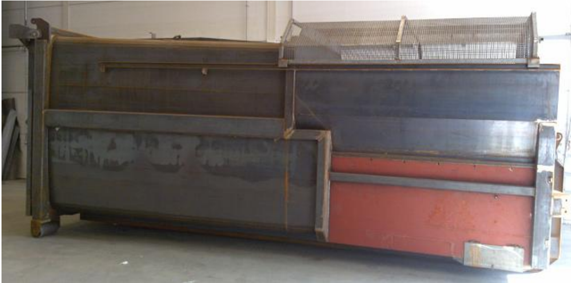
Compactador recién fabricado.