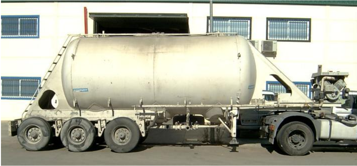
CISTERNA MUY DETERIORADA.