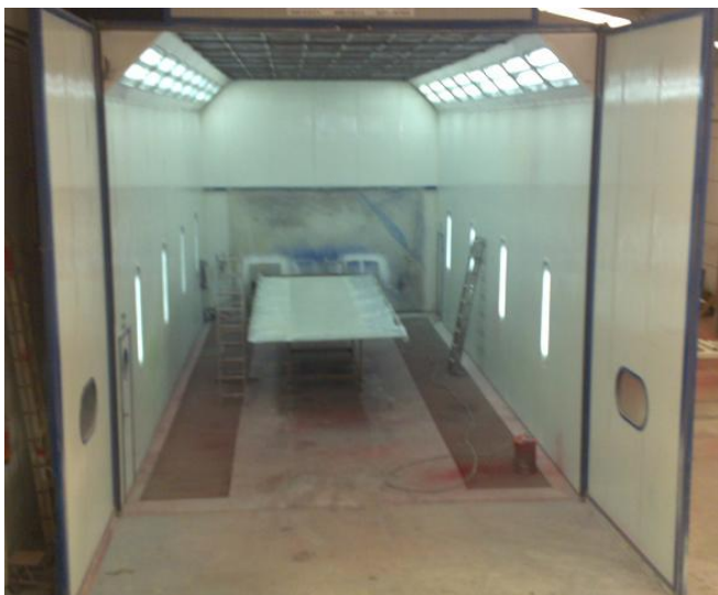
Cabina de Pintura. 13 metros de longitud.

Lo cual se traduce en un trabajo final de una calidad excelente.