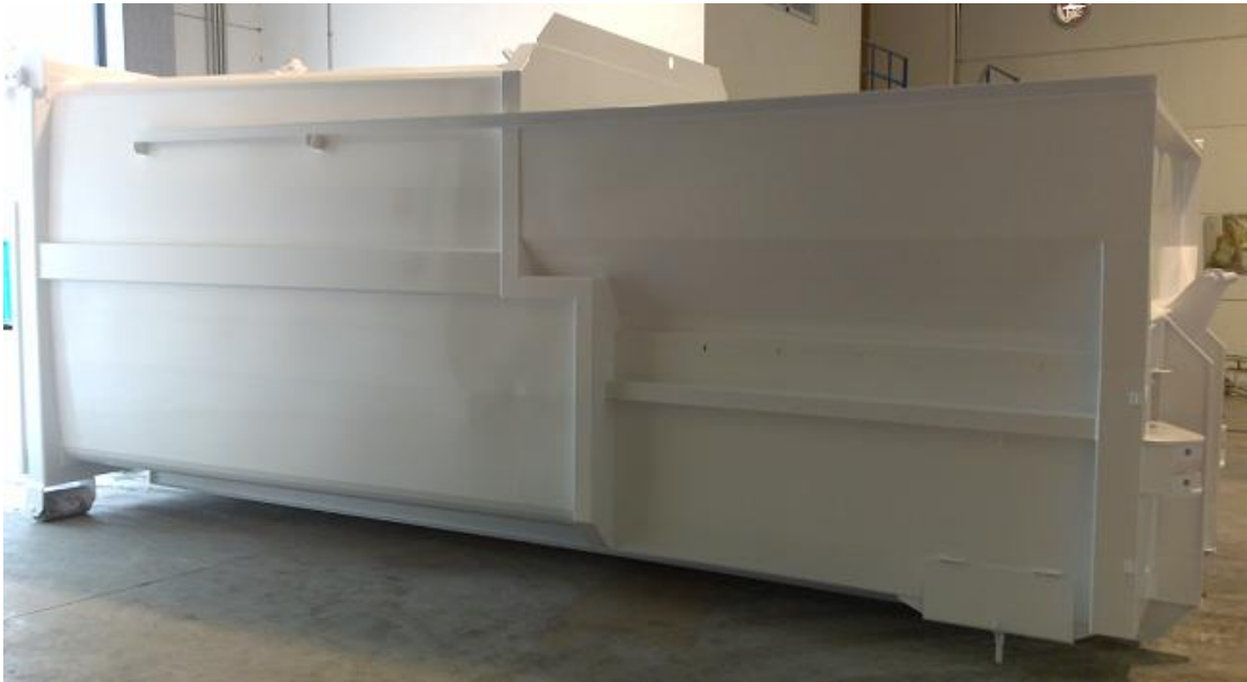
Compactador una vez aplicado todo el proceso.