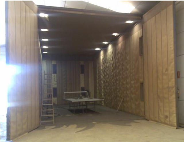
Cabina de Granallado. 13 metros de longitud.

Con este procedimiento obtenemos un resultado de garantía y evitamos sistemas más costosos, arcaicos y menos satisfactorios, como el zincado o la galvanización.